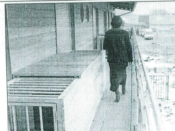
Les niches sur les coursives. De l'extérieur peut évoquer un bateau d'où son nom « Le Pourquoi pas », clin d'œil au navire du docteur Charcot.

La construction représente un investissement d'1,5 millions d'euros, financé par le maître d'ouvrage, l'ESH Picardie Habitat qui loue au Sato.